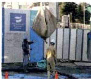
5.クレーン等で吊り上げ開始