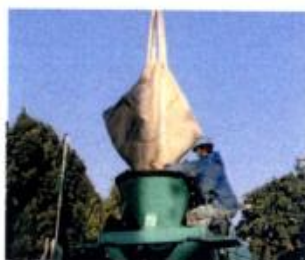
6.ミキサー車ホッパー上で排出