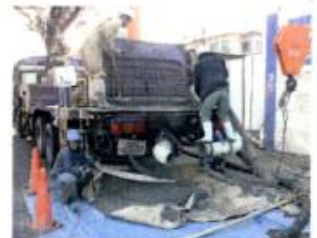
4.ホッパー内残コンを完全に排出