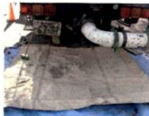
2.シートをホッパーの下へ敷く