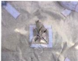
1.シート背面の排出口を結ぶ